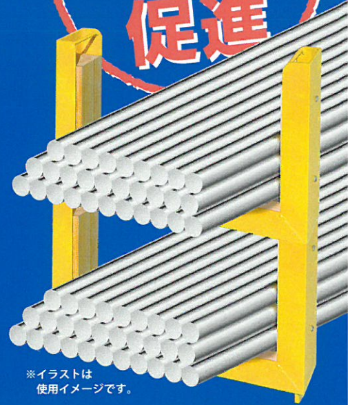
※イラストは 使用イメージです。